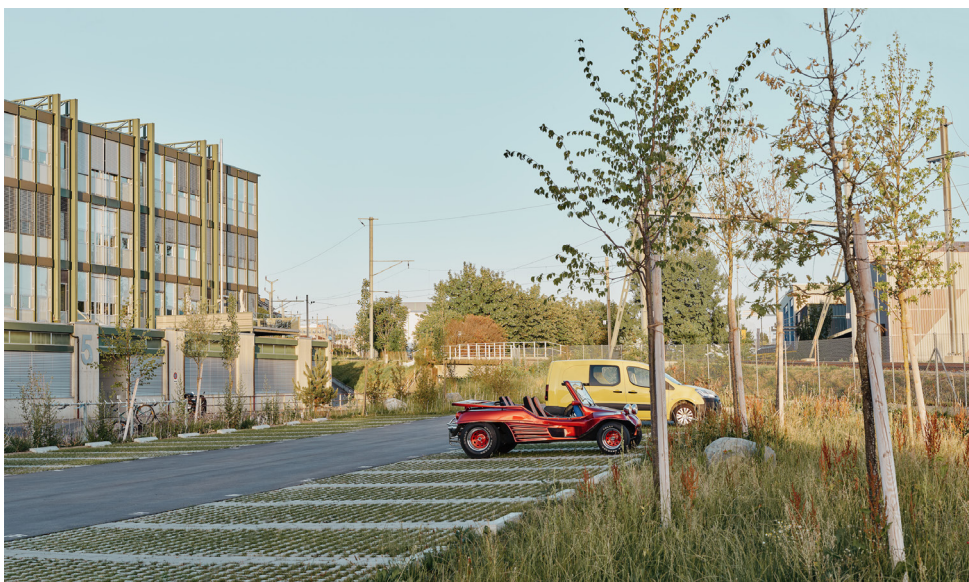
D'une friche industrielle à un parc de stationnement.

« En parallèle de la réaffectation des Ateliers de la Ville de Renens, le parking au Sud du site, en contact direct avec le réseau CFF, se voit réaménagé en une zone généreusement végétalisée. »