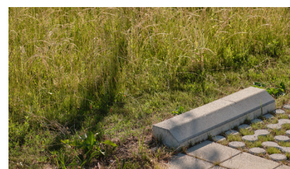
Stationnements perméables.

Les stationnements sont également marqués par des revêtements perméables, alliant confort d'usage et respect du cycle naturel de l'eau. Du fait de la légèreté et de la réversibilité de cette installation, le secteur Sud-Ouest des Ateliers peut envisager à l'avenir une mue vers un parc d'entreprise ou de quartier.