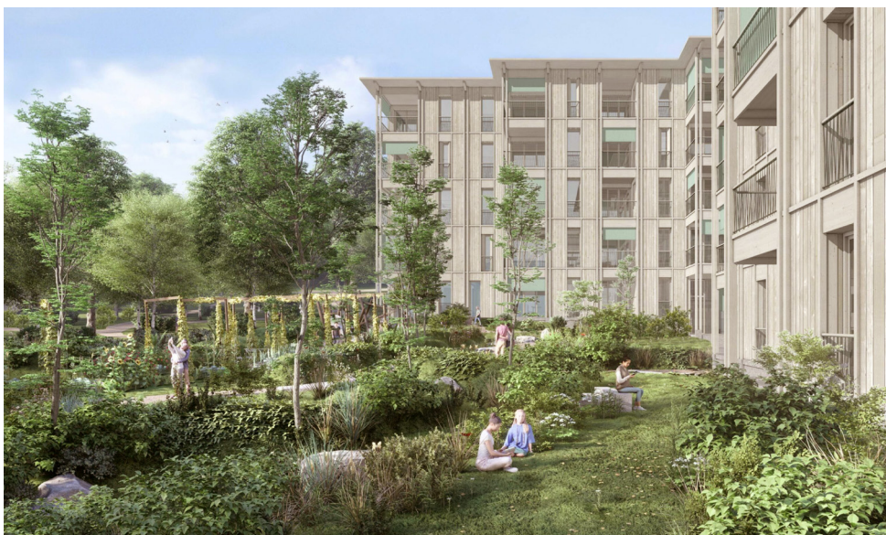
Des jardins qui se lient aux boisements proches du quartier. Illustration de projet

« Favoriser les espaces de rencontre et la convivialité parmi les résidents tout en intégrant les principes environnementaux et les valeurs humaines. »