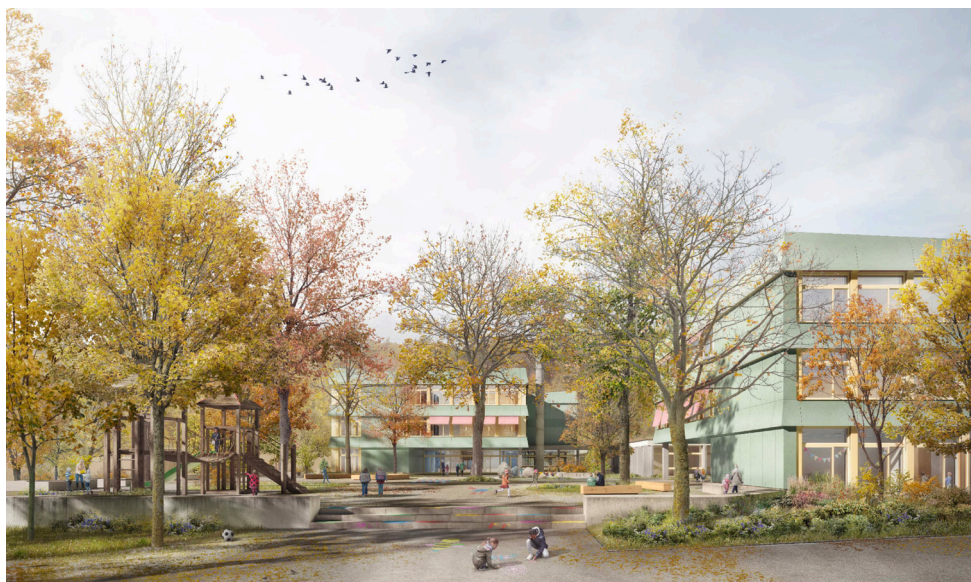
Un préau arboré, apportant ombrage et couleurs saisonnières. Illustration de concours

« Valoriser les éléments naturels existants et offrir aux enfants une variété d'activités tout en préservant des espaces libres pour favoriser leur développement social et cognitif. »