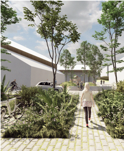
Une végétation généreuse. Illustration de projet

Différents parcs, vergers et jardins offrent un panel d'activités, allant des rencontres et échanges dans de grands espaces ouverts à des moments de ressourcement dans un contexte plus intimiste, propice au calme et à la détente.