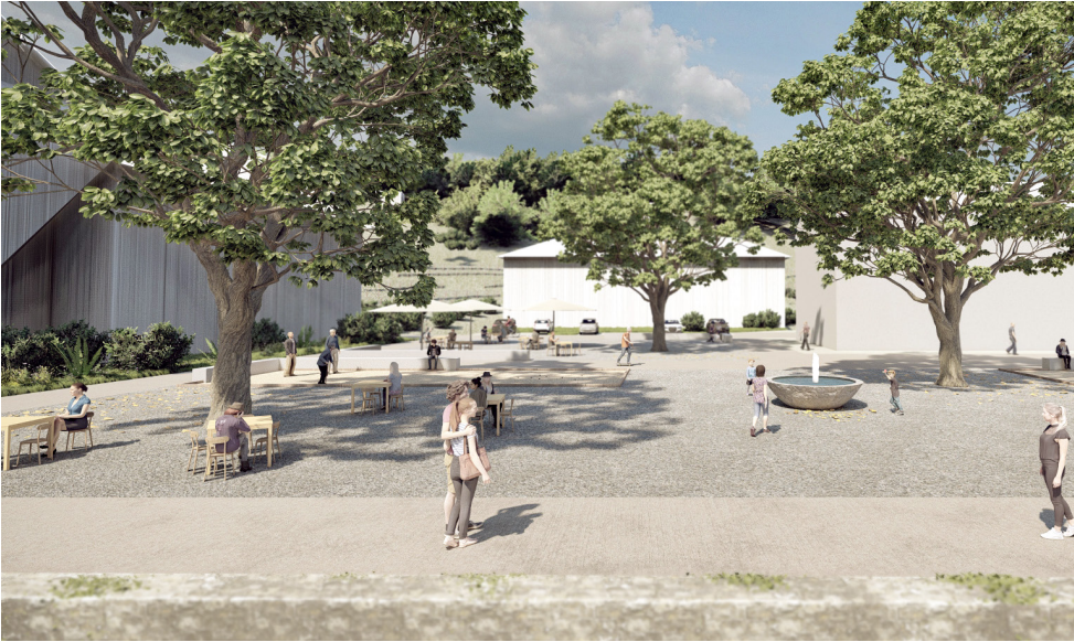
Nouvelle placette du village. Illustration de projet

« En activant les différents jardins, cours historiques et points de vue du domaine Bethesda, le site se transforme en un nouveau campus hospitalier en prolongation du tissu villageois de Tschugg. »