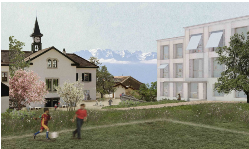
Visualisation du projet du rendu du concours. Illustration de projet

« Au-delà d'une intégration paysagère en cohérence avec le génie du lieu et d'un traitement optimisé de la topographie locale, le projet vise à mettre en valeur son environnement direct. »