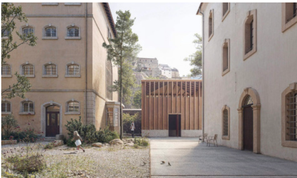
Vue depuis la cour en direction du pavillon d'accueil, avec le château en arrière-plan. Illustration de projet